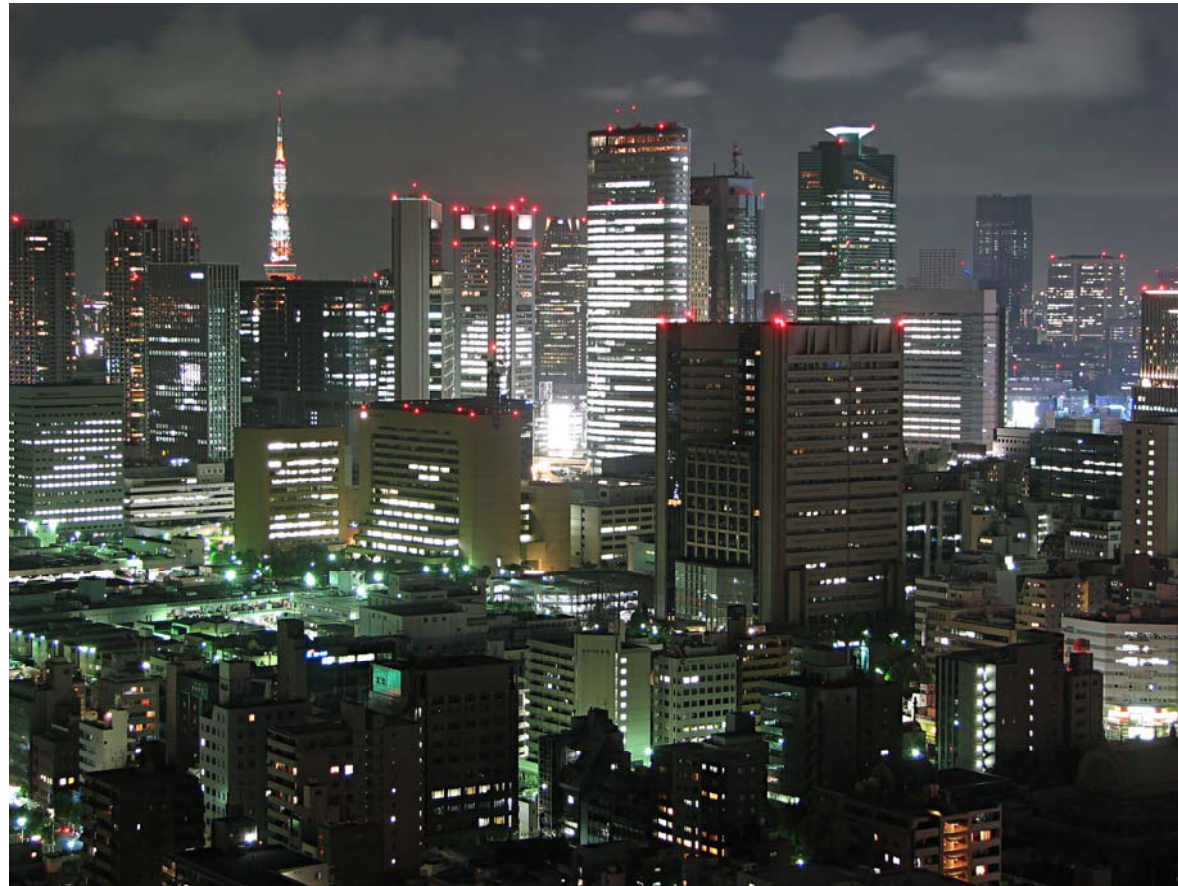
Ort: Tokio